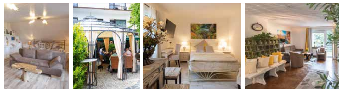
Ferienwohnungen für 4 – 8 Personen