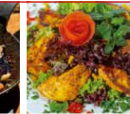
Hühnerbrust-Filetspitzen auf Salatbett