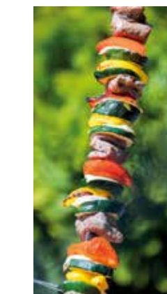
Rindfleischspieß mit Roastbeef Beef skewer with roast beef