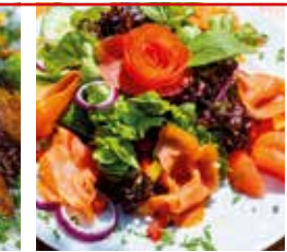
Sommersalat mit geräuchertem Lachs