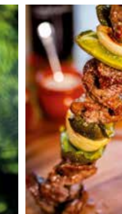
Lammspieß Lamb skewer