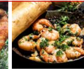
Gambas al Ajillo