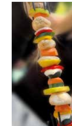
Gemüsespieß mediterran VEGAN UND VEGETARISCH Vegetable skewer Mediterranean VEGAN AND VEGETARIAN

Herzlich willkommen auf der Brathähnchenfarm – genießen Sie Ihren Aufenthalt und unsere Speisen bei uns!