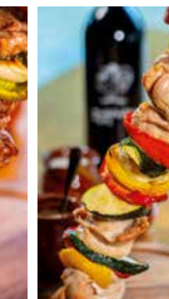
Mediterraner Putenspieß Mediterranean turkey skewer