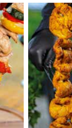
Orientalischer Hühnerbrustfilet-Spieß shish-kebab